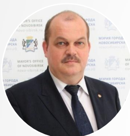
Ахметгареев Рамиль Миргазянович начальник департамента образования мэрии города Новосибирска