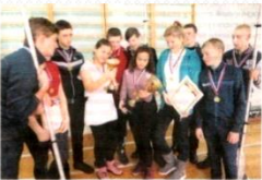
Туристическая группа объединения «Водник-эколог» вместе с педагогами.