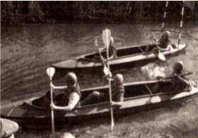
Всплывший сплав по реке Сухого Дон в преддверии байдарки. При организации сплавов всегда важно быть готовым к любым ситуациям. Это правило обязательно на соревнованиях, в том числе и на тренировках.

Тренировки группы объединение «Водник-эколог» вместе с педагогами.