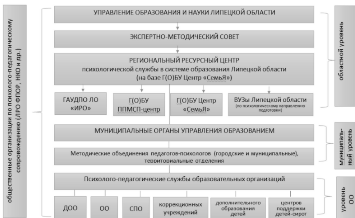
Рис. 6. Модель психологической службы в системе образования Липецкой области

Структура модели службы в системе образования Липецкой области представлена на рисунке 7.