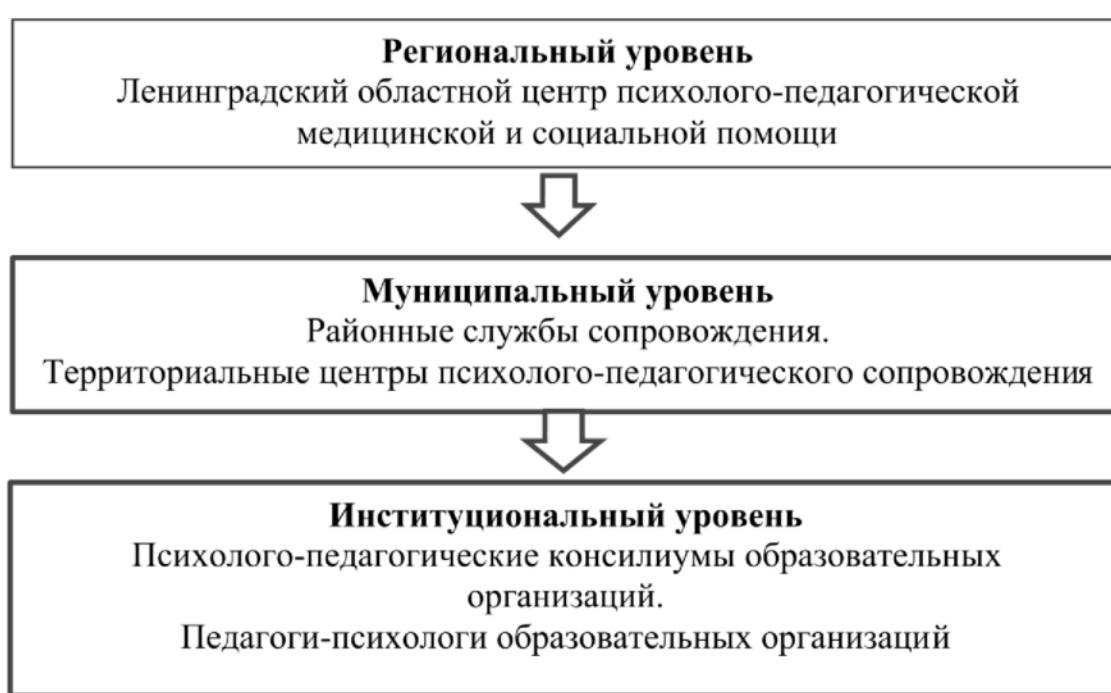
Рис. 7. Трехуровневая система психолого-педагогического сопровождения

Основная цель психологической службы в системе образования Ленинградской области – обеспечение психического и психологического здоровья обучающихся и педагогов. Основу модели психологической службы в системе образования Ленинградской области составляет организационно-функциональная трехуровневая система комплексного сопровождения. Модель описывает территориально-организационную подчиненность педагогов-психологов, их профессиональный и количественный состав.