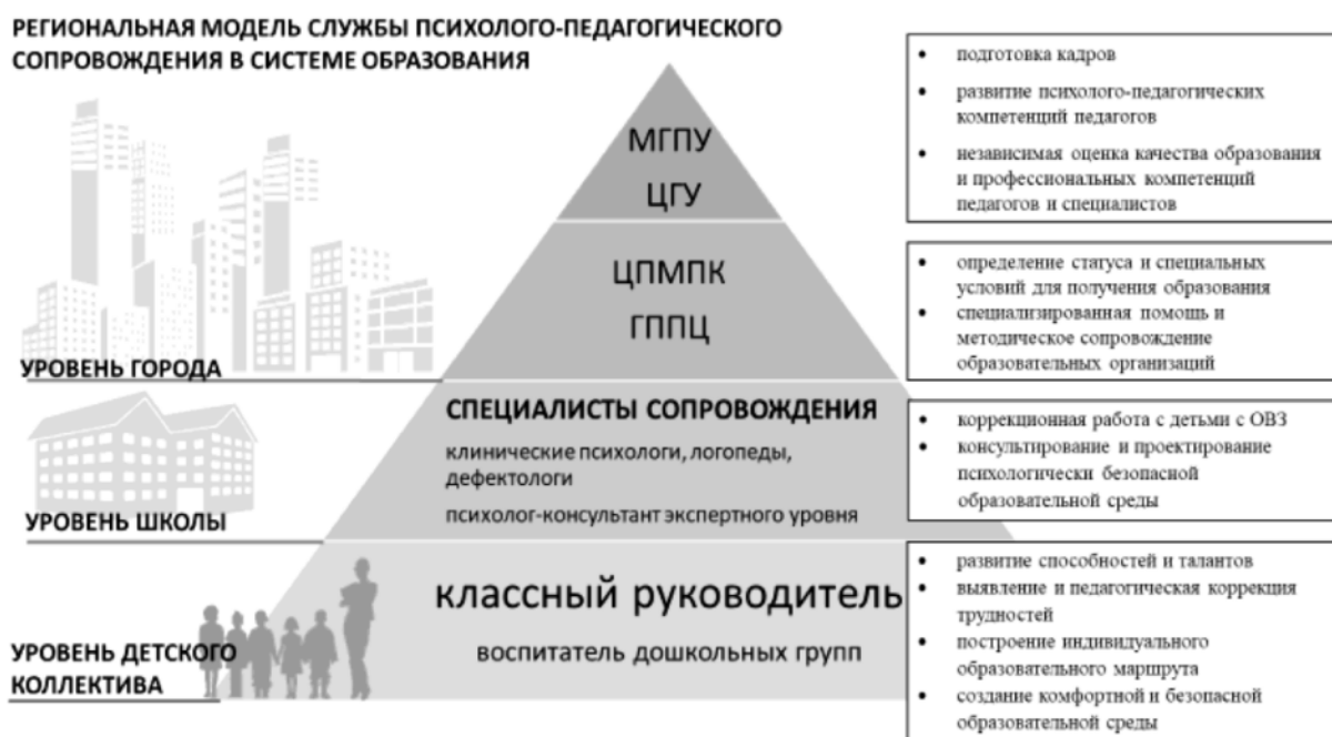
Рис. 1. Модель психолого-педагогической службы города Москвы