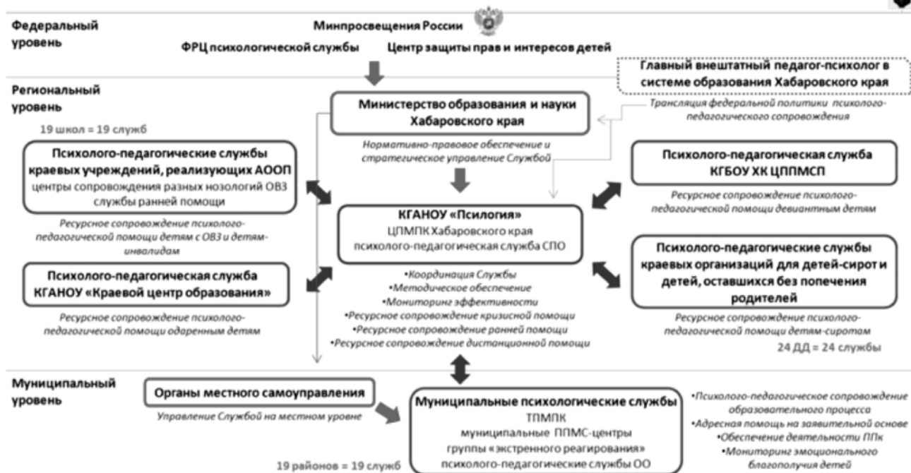
МОДЕЛЬ ПСИХОЛОГО-ПЕДАГОГИЧЕСКОЙ СЛУЖБЫ В СИСТЕМЕ ОБРАЗОВАНИЯ ХАБАРОВСКОГО КРАЯ

Другие элементы Службы децентрализованы.