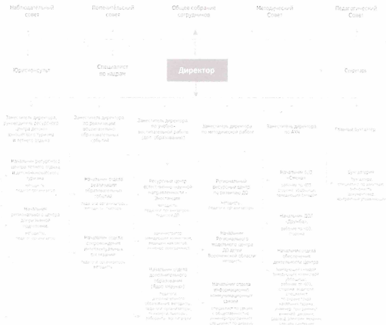
Система управления организации