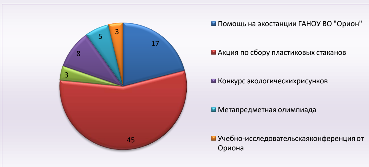
Рисунок 1. Количество обучающихся по программе, которые приняли участие за 2022-2023 год

Приобретаются практические навыки, которые обучающиеся используют при проведении экологических мероприятий, лекций, конкурсов, научных конференций и т. д. Это способствует формированию положительного отношения к охране окружающей среды, пониманию своей роли и места в поддержании общего биоразнообразия и экологического равновесия.