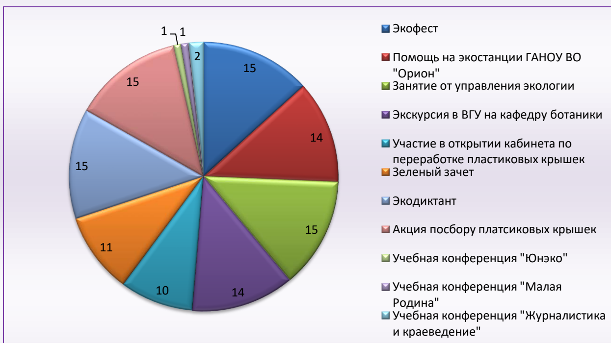
Рисунок 2. Количество обучающихся, которые приняли участие за 2023-2024 год

На рисунке 2 представлены данные количества обучающихся, которые принимали участие в период с 2023 по 2024 учебный год. На данный момент число участников всех мероприятий составило 113 человек. При этом учебный год еще не закончился и в ближайшие месяцы есть мероприятия, в которых примут участие обучающиеся программы.